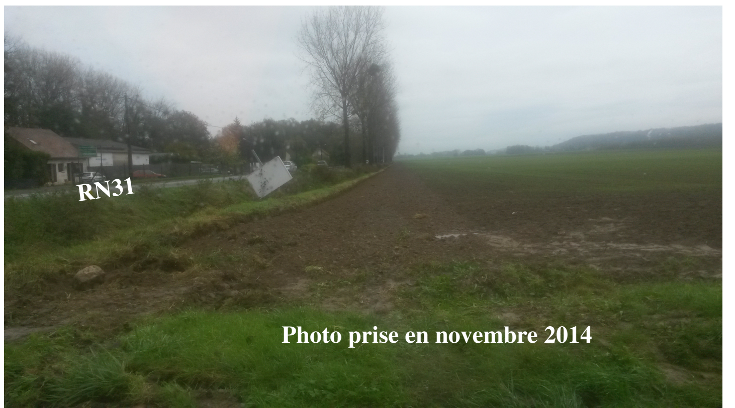
Photo prise en novembre 2014

Si vous avez eu l'occasion d'emprunter ce sentier, n'hésitez pas à nous envoyer votre témoignage.