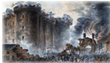
Le 14 juillet