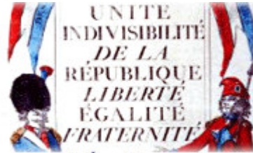
Liberté, Égalité, Fraternité