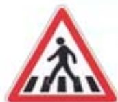
Passage pour piétons

Les panneaux ayant la forme d'un triangle bordé de rouge annoncent un DANGER