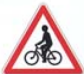
Débouché de cyclistes ou de cyclomotoristes venant de droite ou de gauche