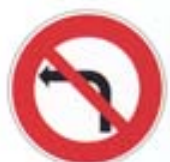
Interdiction de tourner à gauche à la prochaine intersection