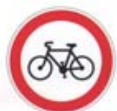
Accès interdit aux cyclistes