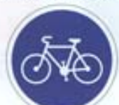
Piste ou bande cyclable pour les cycles