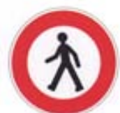
Accès interdit aux piétons

Les panneaux ayant la forme d'un rond bordé de rouge annoncent une INTERDICTION