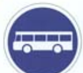
Voie réservée aux autobus