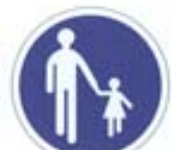
Chemin obligatoire pour piétons

Les panneaux ayant la forme d'un rond bleu annoncent une OBLIGATION