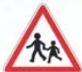
Endroit fréquenté par les enfants